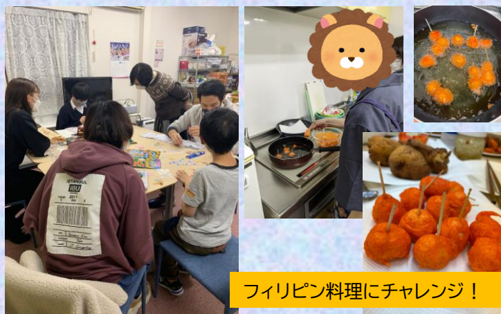
フィリピン料理にチャレンジ！

昨年度末から徐々にサロンでの活動が再開しました。約2年間のサロンでの活動休止中に沢山の子どもや学生スタッフが卒業し、また新たなメンバーが集まりました。手探りではありますが、これまでのスタイルを引き継ぎつつ、今のメンバーで出来ることを考え、子どもたちが楽しく安心して過ごせる居場所を作っていきたいと思っています。今年度もどうぞ、よろしくお願い致します。