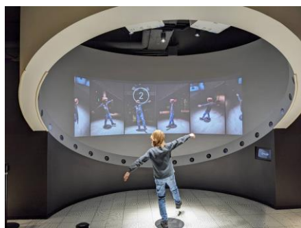
科学技術館に行ってきました♪