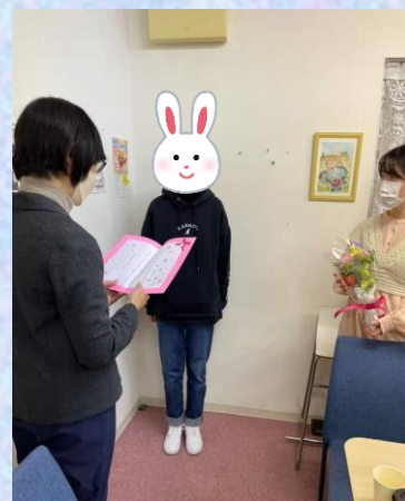
MLTを巣立って高校生活をスタートします。 3月、三崎町サロンで卒業を祝うことができました。

2021年度もコロナの影響は大きかったものの、12月から活動拠点である神田三崎町のサロンが一定の条件のもと利用できるようになり、子どもたちとの時間が戻ってきました。学生スタッフは新メンバーも加わり、久しぶりにサロンのキッチンを使っのボナペ（食育の時間）を子どもたちと一緒に楽しんでいます。昨年度は千代田区からの表彰もいただきました（裏面をご覧ください）。