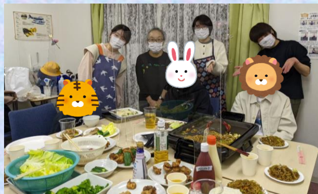
三崎町サロンでのボナペが再開しました！！

大学に入学と同時にMLTに参加をはじめ、あっという間に卒業してしまいました。後半の2年間は、思い通りの活動が出来ず本当に悔しい思いでいっぱいですが、ようやくこの生活の終わりという明るい兆しも見えてきたように思います。直ぐ元通りは難しいかもしれませんが、これからもどんな形であれMLTが子供たちにとっての居場所であり続けられるように心から祈っています。4年間本当にありがとうございました！